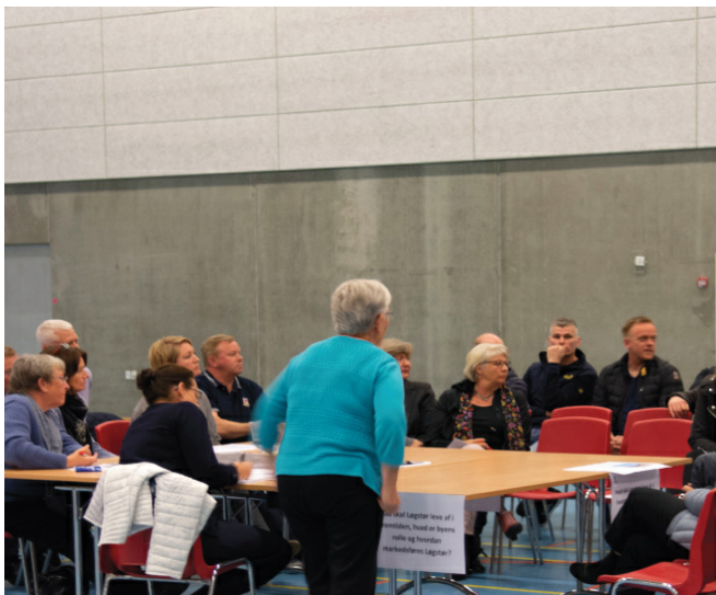
Sammen skaber vi Vesthimmerlands Kommune Afrapportering fra § 17, stk. 4-Udvalget om Borgerinddragelse

Byrådet besluttede i januar 2018, at der skulle udarbejdes et forslag til procesforløb for yderligere borgerinddragelse i Vesthimmerlands Kommune. Formålet var i første omgang at få kortlagt, hvordan Vesthimmerlands Kommune inddragede borgerne.