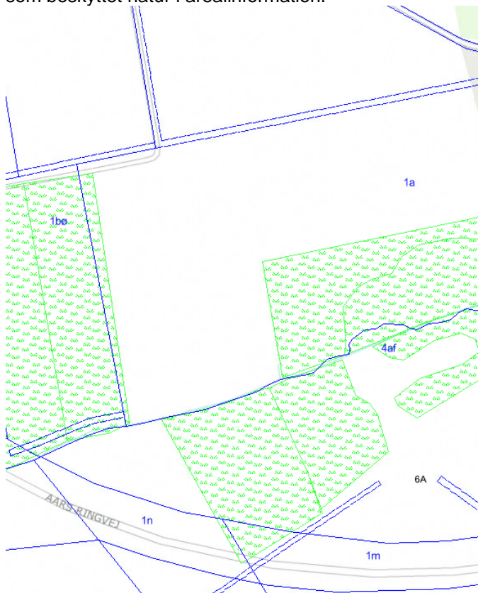
Matr. 1a, Stenildvad gdr., Aars med markering af beskyttet eng

landzonetilladelse at etablere bassinerne i områderne. Bassinerne etableres i områder, der ikke er udpeget som beskyttet natur i arealinformation.