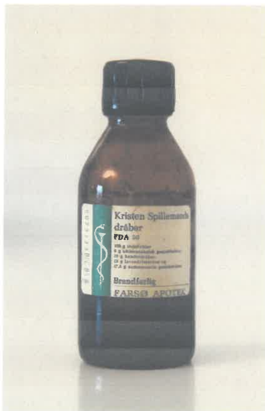
Fra Farsø Apotek